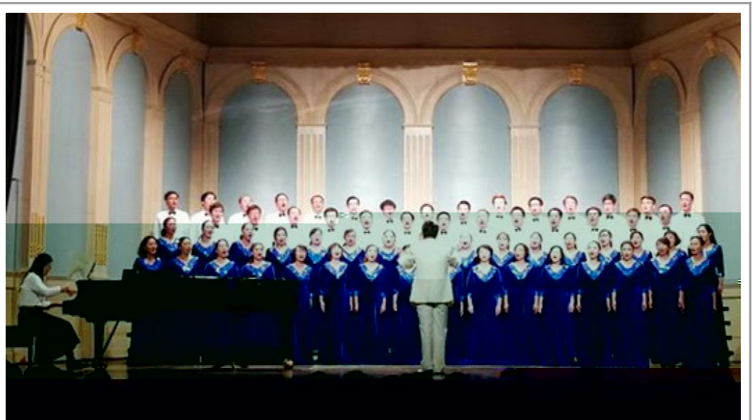
12 14 晚 合唱团演唱《天路》参演 欢歌 K < 合唱音乐 示 饱满 精神状 & Z A 7 素 M

由 市 I 部 践 M 二等 U { “m n +” k 市 文明 办 市 J 作 市 景 下 智 化 o 家 养 p q 调 团 市 和 市 办 的 及 发 展 H —— 以 r 新 为 s c 等 4 个 Q R 三等 U “$ K # L” 2016 t 军 和 4 u Q R 市 践 市 生 践 MNOP 优 g 指 导 师 v 等 4 位 同 继 2015 QR “ST 组 织 U” 之 后 V 又 W 了 2016 QR 市 践 进 个 人 “$ X” 市 生 hi 践 M “优 Y X” / 践 V 205 个 团 队 团 队 色 Z R 家 级 市 级 w 级 践 内 容 x y 三 下 政 H 讲 情 z { 文 化 I | } J 生 育 ~ • 生 对 ^ _ ` a 建 验 与 特 点 环 境 ! % # 专 业 践 等 的 调 b 与 c 团 队 QR “2016 3000 名 同 200 位 p 专 生 志 愿 者 d 期 e 三 师 $ % & 各 地 展 践 同 时 下 ` f 践 优 g 团 队 ” h 为 阔 生 的 眼 + 培 育 i [ 放 “二 j ” k 景 下 ) 精 子 际 视 野 的 线 师 V ' ( I 认 $ 度 对 调 bc 等 3 个 了 ) 流 践 QR “$ X” 市 生 v 团 8 供 稿 W