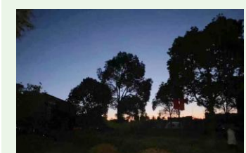
详细报道见 2 版