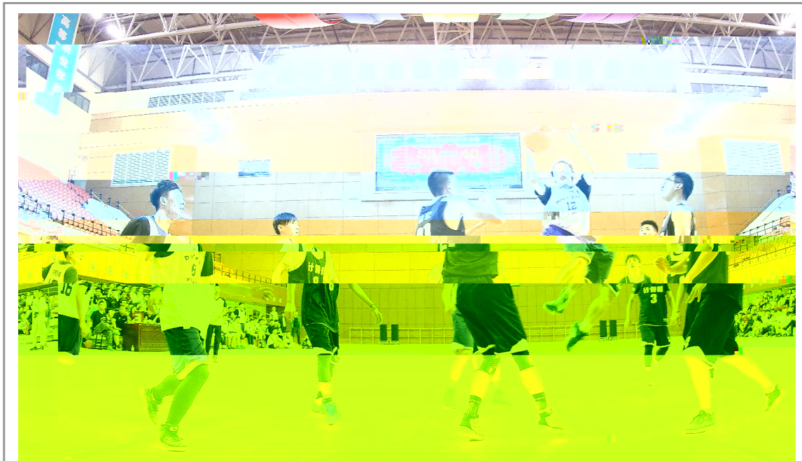
€ 0 6C; < 78Y < 9: ^ < => 5 6 8 $ H! ? @ wAD E: BCQCRDME% * F! Ge H*! KJK w3 L> OE MKNKw c O=SP??; < O6 CQ RS *TUP? MOE CVVMX: YZ %

! " # 5 20 取得 全国大 预X 参 本 等 \得 大 I : 大 在 F A 6 参加 国区 大 举行 ^ 由 (Microsoft) 国 f 自y 大 华东理 大 Pearson 培I VUE和 有 近 w f 理 大 等 14所> 151 N 限公司t 合 办 承 Y 在 国( )国际 4参 E E和 办 S MOS大 华 : X 20 由 指导 马 团 项 XM 出S \ 等 4 得 业 项目 5 目和黄 忠 指导 e 等 6e S等 10e 项 银 9项 6项 团 项目\ 得大 等 b 5e y' \ 得 组