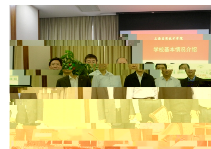
学校基本情况介绍

2013 10月15日 # 237 $ %&' ( ) * +CN31-0826(G) / O1 2 3 4 5 6 7