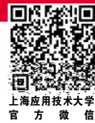
上海应用技术大学 官方微信