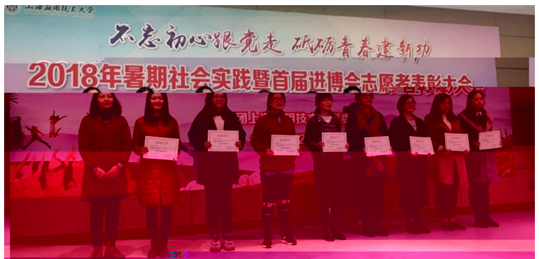
（“不忘初心跟党走，砥砺青春建新功”2018年暑期社会实践暨首届进博会志愿者表彰大会举行。图为先进个人、优秀指导老师、优秀组织单位和首届进博会优秀志愿者等获表。）

12月19日，校、离退休工作员会和原校级、30余退休欢聚一堂，叙学发展、迎己亥新春。代表学校政向会和老和们致以诚挚的问候和切的祝福，就学校上级关政和整情、校测情向会老同志做表，广大离退休老同志学校的宝贵财富，学校发展的资。学校各的，！全校师生作、砥砺奋进的，离老同志们"年的#$、辛勤%&。老同志们学校、发展'的就表(的)*，++表，-关、支持学校的和发展。(离退委供稿)