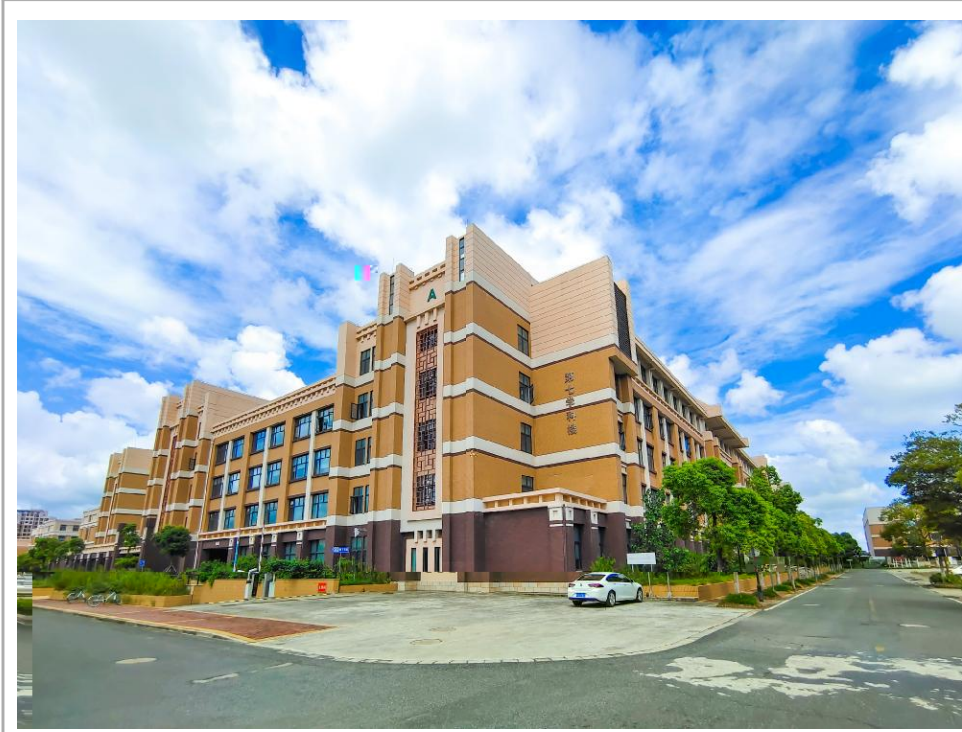
与云为伴

mm正正s?去"[i [更多{ * `科#cnOY士Uq Z J听! Z @U 5 安c $HI "他们又说X^们c\ 没{白l " z" O 活c安 定"kl 血o /"p山E: qJ_<风z="他们c•; 被风 r 模s" "> • [ { 5?cN 律X; A外"B道 DD_ 方Yzb' 说( X) c * [ "t@] ~uvw"xy } ~u" zy"富{ } ~u" | } "~健" ~u" • 苦"yK} ~u" 愚昧" 友, } ~u" 仇 杀" 之快乐" ~u死之v哀" k媚cg4} ~u" 凄凉c 荒 /J_P光 回"Z @UcG H" [ ^亲眼T见J外 l c 打1没{打( ^们"突: 其 c f i ; 没{打( ^们"; | V 坚战取y" P " * S众瞩 Pc2w"[ =d, c\ p c" 刻/Q@" ^们: %) f c Y "更• @" ^ hL 起 " ! 富起 "C! ) 起 c 伟f 飞跃J 没{ Wc冬! " { VW c春光Jh c伟34! " +, O手* " * 族伟f 复 梦U * i 夏f / \ /航J c * " c * 子孙"} l 更昂 c姿Y"更V| c - % "z * 之[塔添砖加瓦J <风z=" 蒲aU随风: " 梦 c 子飞\ \方" ^zz / 哼?" 5?cN律X; A外" B道 " CC连qDD_