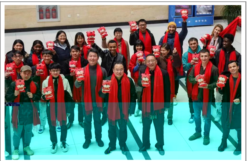
1 / 28 O1* 23456789; ; < 1= > ? @ AB022 CD2* EFGHI JK2 LMNOPQRST 1UD2* VWX# $YZ [ FC\ ] ^ FG_ ` K LM* ab.

日前，上海市第十六届“银鸽奖”评选活动揭晓。我校凭借在“银鸽奖”评选中的突出表现，荣获最佳活动 / 案例奖。此次获奖项目包括：WXe 2021 O产v 研M] 层J 同 新服务平台9_ p产v 研M] 促进K产v 研 M] 新< 促进- . 每O3 4-n" 是面向产v 研界 立PJ 同 新f d誉- 9 v; 积极响{ p家 三角地区 新驱i w 战 略" 1重视产v 研M] ]" s地方 水平大v